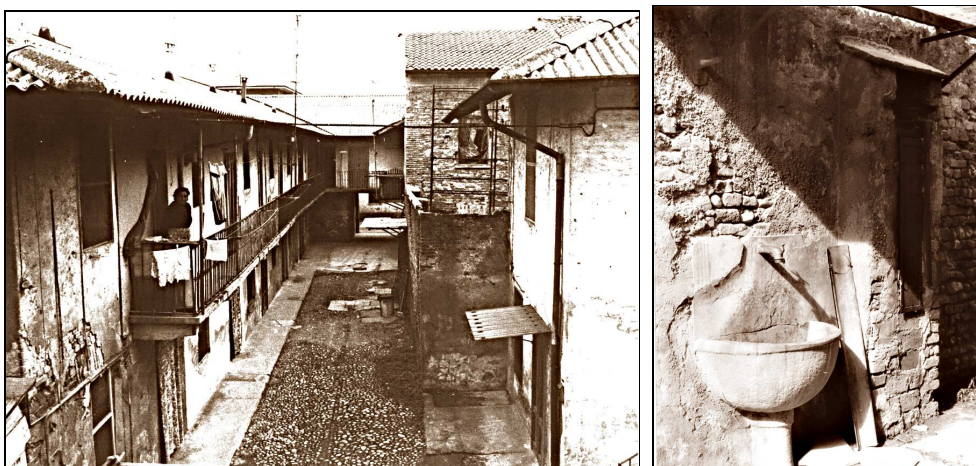
La Curt lunga – Via S. Martino -

La rassegna che presentiamo quest'anno si intitola i vecchi cortili di Melzo. Cortili in cui le numerose famiglie che negli anni '60 e '70 vivevano solidalmente in comune. I molti bambini che animavano i cortili dove i servizi si dovevano condividere con tutti, la tromba dell'acqua, con cui riempire i secchi , i mastelli dove servivano per lavare i panni , la legna e il carbone per la stufa. Tanti i giochi che si svolgevano nei cortili, con le figurine, le biglie, a nascondino, con le carte da gioco, il calciobalilla, il carelot, e altri giochi che al momento si inventavano. Quello che non mancava era la fantasia .